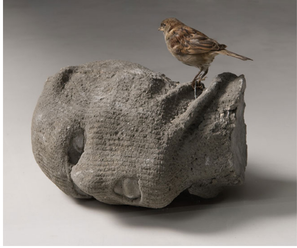
ארז ישראלי , "ראש", 2006, יציקת בטון ופוחלץ דרור,